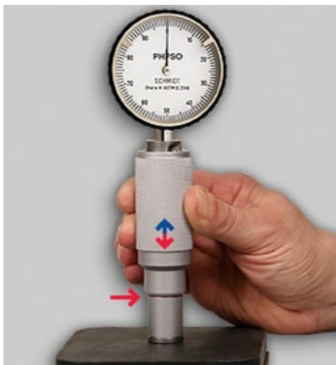
Durômetro Shore PPHSO

Durômetro para determinar a rigidez da superfície de elastômeros macios, materiais elásticos macios e têxteis.